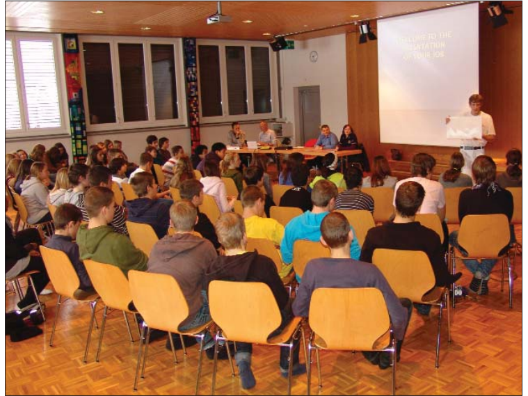
Vollbesetzte Aula in der MPS Rubiswil in Schwyz.

leger-Lernenden die Lehrabschlussprüfung nicht bestanden hätten. Was läuft da schief in der Lehrlingsausbildung? Dieses Ergebnis müsse aufrütteln. Mögliche Erklärungsversuche seien, dass Bauberufe nicht zuoberst in der Hitparade der Jugendlichen seien und begabte Jugendliche weiterführende Schulen bevorzugen würden.